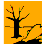
Niebezpieczny dla środowiska

Zawiera: toluen, benzyna lekka obrabiana wodorem.