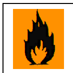
Wysoce łatwo palny